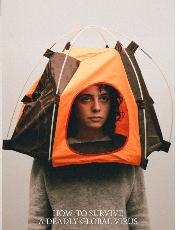
HOW-TO SURVIVE A DEADLY GLOBAL VIRUS