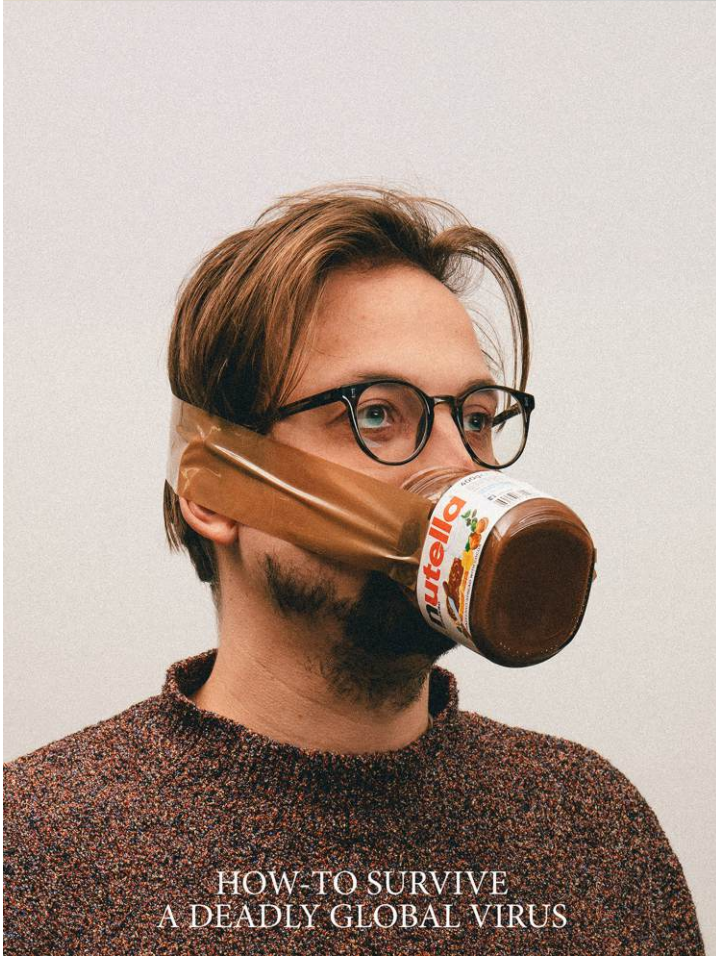
HOW-TO SURVIVE A DEADLY GLOBAL VIRUS